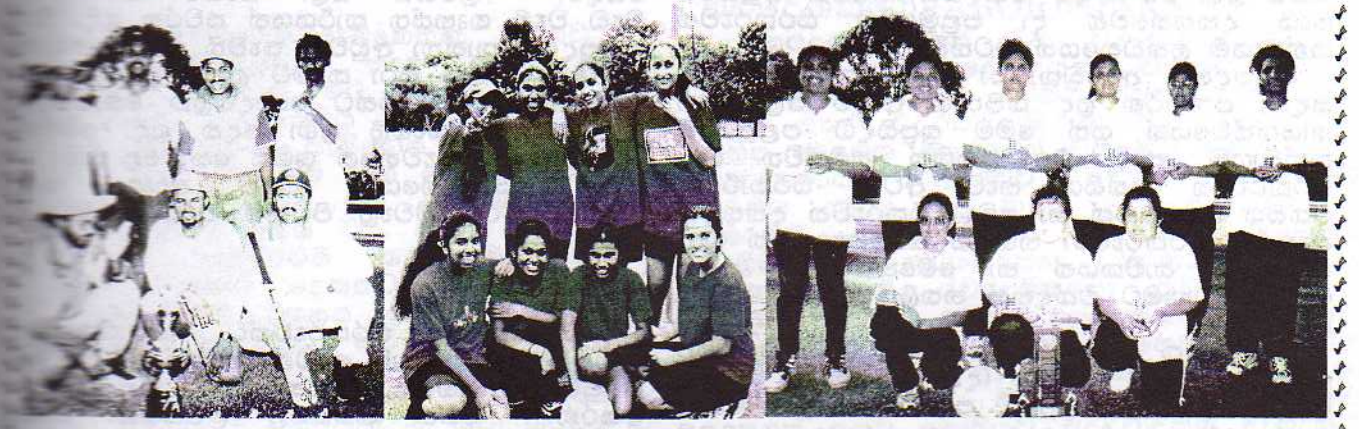
අනුඉරතාවය "NOBLE PARK A"