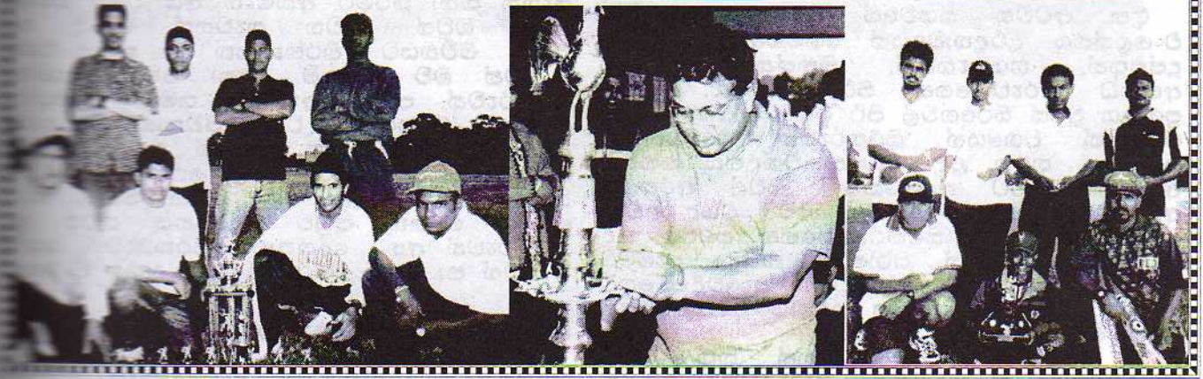
අනුඉරතාවය "SUPER SIX"