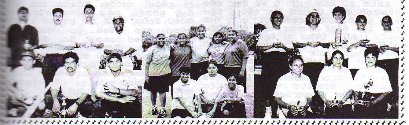
අනුඉරතාවය "YELLOW BIRDS"

0 0 5 5 ? තාක් න්පතු මෝන්. මෙවිමි 0 හා න 10- ර්වන ස්තුව මෙක.)